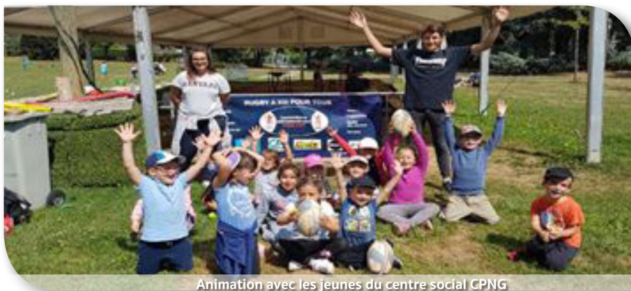
Animation avec les jeunes du centre social CPNG

le Comité du Rhône et Métropole de Lyon de Rugby à XIII a participé à l'opération Rhône Vacances mise en place par le Conseil Départemental du Rhône au Parc de Chaponnay du 17 au 28 Juillet Ainsi deux animateurs du Comité, ont proposé des modules découverte du Rugby à XIII avec des ateliers sur le placage - tenu – défense – parcours technique et rencontre à toucher. Ces animations ont permis d'initier au rugby à XIII plus de 230 jeunes dont 38 % de filles .