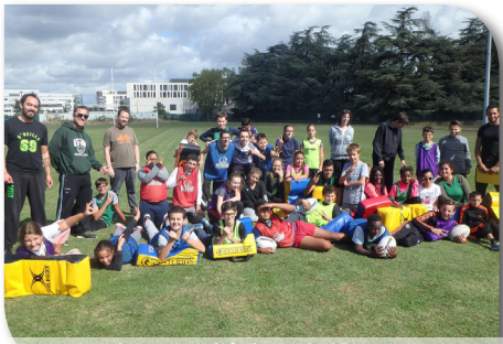
Les jeunes collégiens de Mere teresa