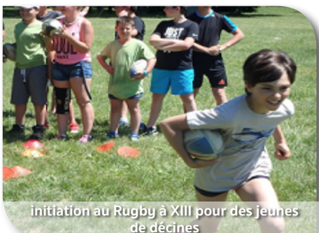
initiation au Rugby à XIII pour des jeunes de décines

la DDCS du Rhône. Au programme plusieurs ateliers dont le taekwondo, escrime, VTT, handball, Rugby à XIII, tir à l'arc...Tous sont venus pour essayer, pour s'amuser et pour gagner aussi... sous une météo estivale ! Un grand Merci aux animateurs.