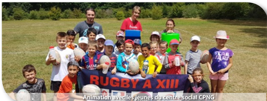
Animation avec les jeunes du centre social CPNG