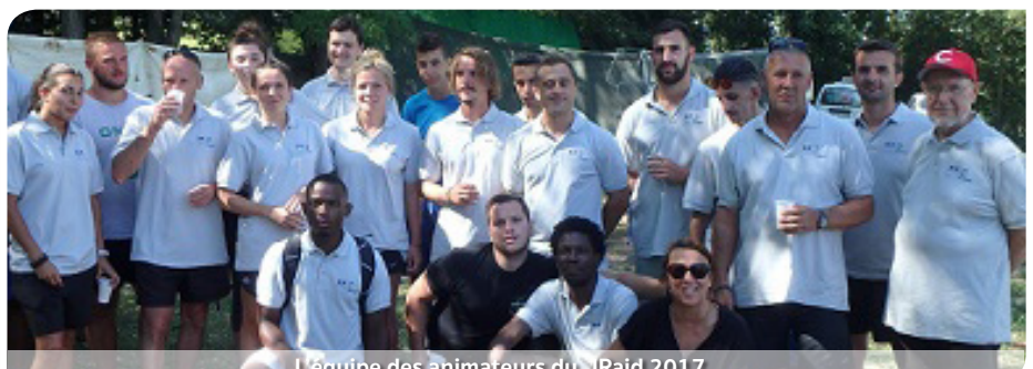
L'équipe des animateurs du J'Raid 2017