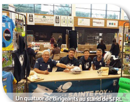
Un quatuor de dirigeants au stand de SFRL

du Loup. Un vrai succès pour la pratique de l'Ovale dans ce jeune club de SFRL dont le stand a remporté le premier prix. Caluire avait aussi son forum des associations et le Président et son équipe ont été très présents..