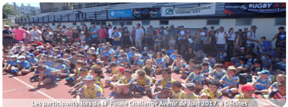
Les participants lors de la Finale Challenge Avenir de Juin 2017 à Décines

C'est parti pour la reprise des entraînements dans les écoles de Rugby des clubs de la ligue Rhône-Alpes. Le Challenge Avenir AURA qui a connu encore un beau succès la saison dernière est reconduit cette saison pour la cinquième édition. La première étape aura lieu au stade Lyvet de Villeurbanne le samedi 14 Octobre. Une date à cocher dès maintenant. D'autre part le challenge Michel Debeaux a été mis en place et remplacera la finale. Il aura lieu le samedi 16 Juin à Décines et sera ouvert aux écoles de Rugby à XIII des autres ligues.