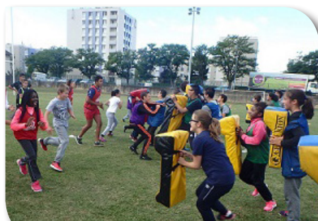
Atelier dépassement de soi