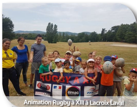
Animation Rugby à XIII à Lacroix Laval

garçons et filles de 8 à 16ans initiés au Rugby à XIII dont plus de 35 % de filles, ce qui est une augmentation de 30% des participants par rapport à 2016. Merci à tous pour ces bons résultats.