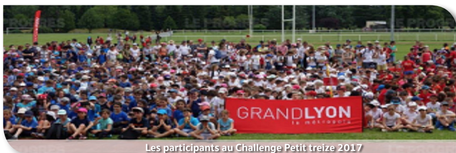
Les participants au Challenge Petit treize 2017

Après le succès de la treizième édition en Juin dernier, le Comité du Rhône et Métropole de Lyon de Rugby à XIII prépare déjà la quatorzième édition qui aura lieu au Parc de Parilly le vendredi 1 er Juin 2018. Une date à retenir dès maintenant dans vos agendas. Les animations dans les écoles primaires affiliées à l'UGSEL du Rhône ont repris début Septembre et se poursuivront toute l'année scolaire. Plus de 15 établissements ont renouvelé leur inscription.